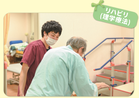
リハビリ (理学療法)